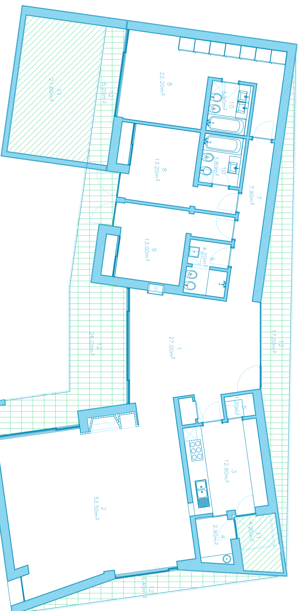
PLANTA PISO 0